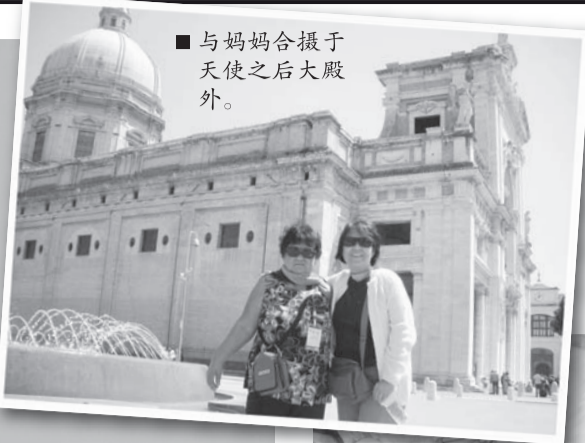
■ 与妈妈合摄于天使之后大殿外。

之后我们还去了圣女佳兰大殿，瞻仰了圣女佳兰，她是眼疾病人的主保圣人之一，我请妈妈也做了个祈祷。